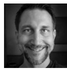
Thomas Bayer Orientation in Objects GmbH