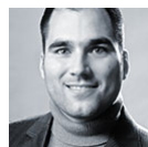
Papick Taboada Orientation in Objects GmbH