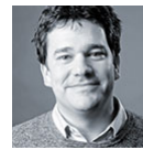
Dirk M. Sohn Orientation in Objects GmbH