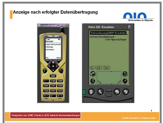
Abbildung 4: Anzeige nach erfolgter Datenübertragung