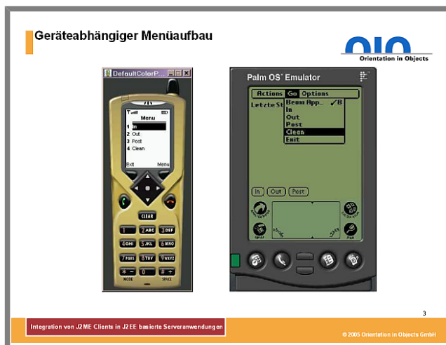
Abbildung 3: Geräteabhängiger Menüaufbau