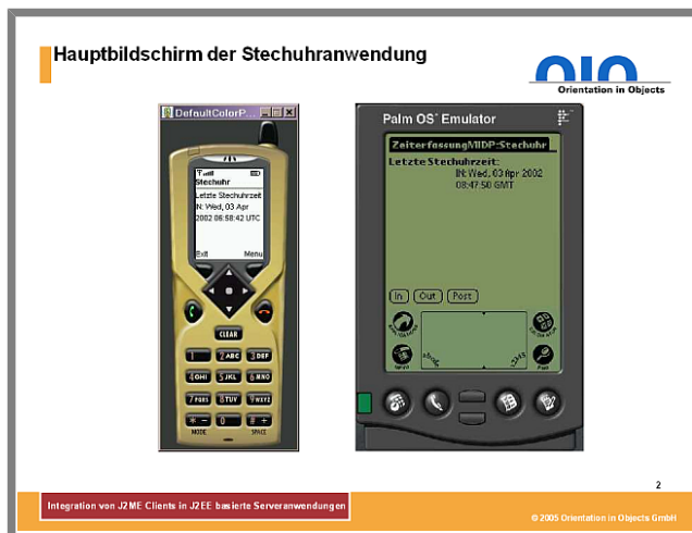
Abbildung 2: Hauptbildschirm der Stechuhrenanwendung