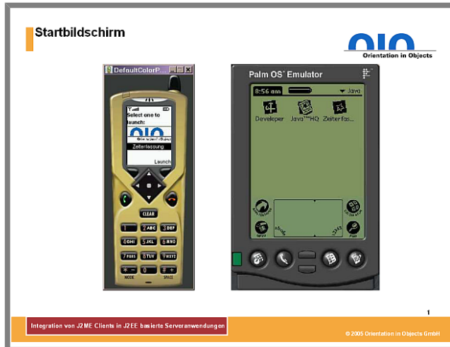
Abbildung 1: Java Startbildschirm

Die folgenden Screenshots sollen zur besseren Veranschaulichung dienen und außerdem demonstrieren, wie unterschiedliche Endgeräte die MIDP Benutzerschnittstellen realisieren. Es handelt sich hierbei einerseits um Screenshots des sogenannten "DefaultColorPhone" des J2ME Wireless Toolkit und andererseits um Aufnahmen des Palm OS Emulators (POSE).