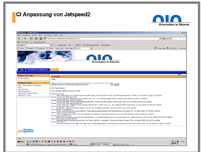
Abbildung 3: Beispiel: Anpassung von Apache Jetspeed2 an das CI

Ebenso versucht Liferay dem Anwender die Angst vor der Anpassung des Portals an die CI zu nehmen. Auch bei Liferay wird detailliert in der Dokumentation auf diese wichtige Facette eines Portals eingegangen und hat wie bei JBoss Portal einen eigenen Bereich in der Dokumentation sowie ein Tutorial erhalten. Hier hat der Benutzer ebenso die Möglichkeiten via XML, CSS, JavaScript und JavaServer Pages vorhandene Themes zu editieren. Auch eine Dokumentation zu Erstellung eigener Themes wird von der Firma Liferay bereitgestellt.